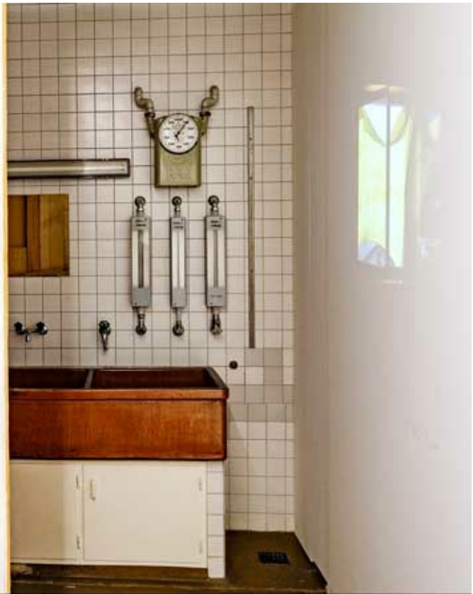
Sabine Trüb, «Vier Wände und kein Raum zu bleiben»