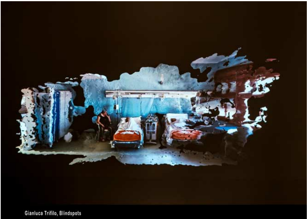
Gianluca Trifilo, Blindspots