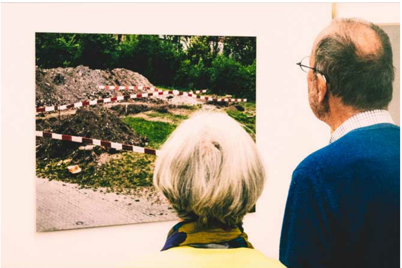
Alex Spichale, Fotografien auf Aluminium