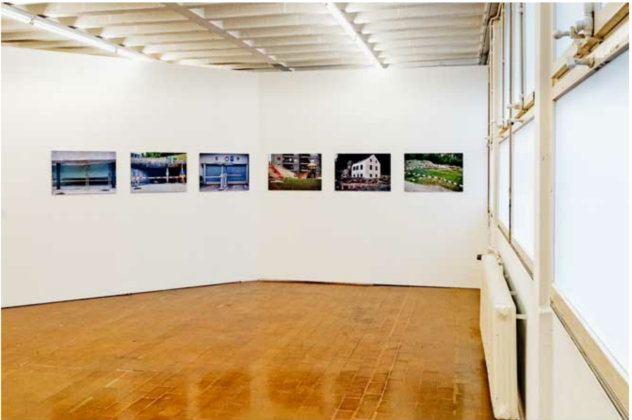
Alex Spichale, Fotografien auf Aluminium